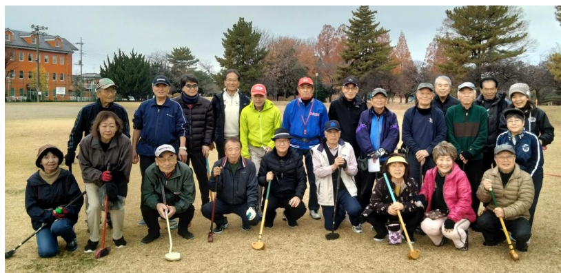
G ゴルフ参加メンバー