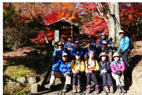
金龍寺参道石段にて

第224回 2025年12/05日(金) 金山ハイク 快晴 13名参加 吞龍様境内に13名集まる。境内の大イチョウはすっかり葉を落とし、他の木々も葉を枯らし冬支度。