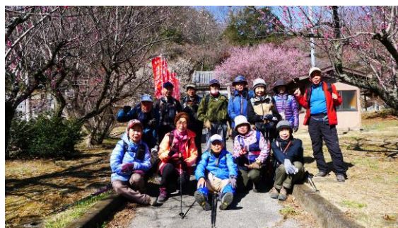
金竜寺門前の梅林で

S さん指導のストレッチで体をほぐし 10 時少し前にスタート。金竜寺墓地内の階段を降り、門前の梅花は満開。赤や白で彩られ春を体感した。墓地の階段の脇に数本の白タンポポがきれいに咲いていた。