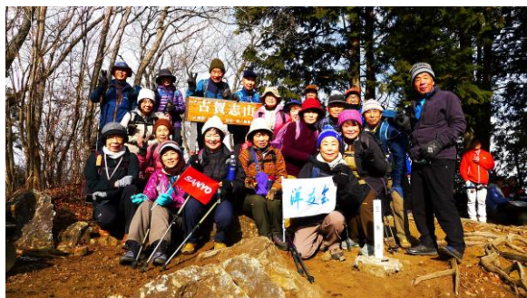
古賀志山山頂より