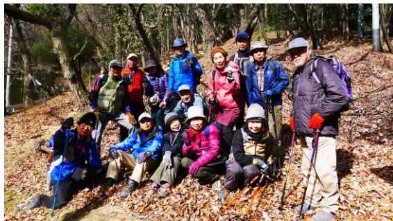
御城橋ガイドンス分岐東屋にて