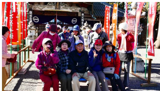
さざえ堂曹源寺で記念写真