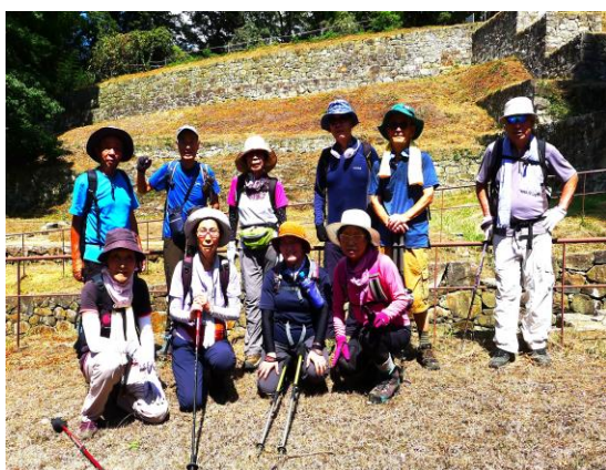
第173回金山城 三の丸をバックに

第176回 10月20日(金) 行き先: 太田金山 コース当日決定 集合場所: 呑竜様境内 集合時間: AM10:00