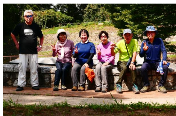
第174回南曲輪休憩所で