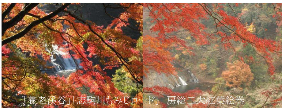
「養老溪谷」「志駒川もみじロード」 房総二大紅葉絵巻