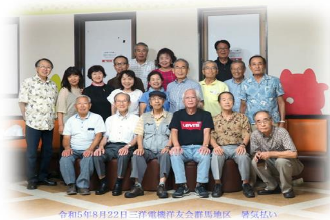
令和5年8月22日 三洋電機洋友会群馬地区 暑気払い