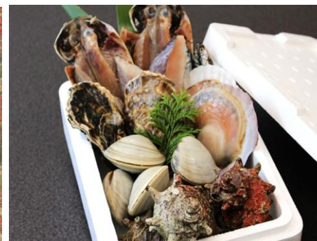
豪華海鮮10種つめ放題

7月のシャインマスカット狩りを中心とした旅行はいかがでしたか？久しぶりに元気な仲間の様子が見られて皆さんとても楽しそうでした。帰りのバス車中で秋の旅行開催を約束しましたが、観光地と日にちが決まりましたのでご案内します。