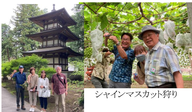
シャインマスカット狩り