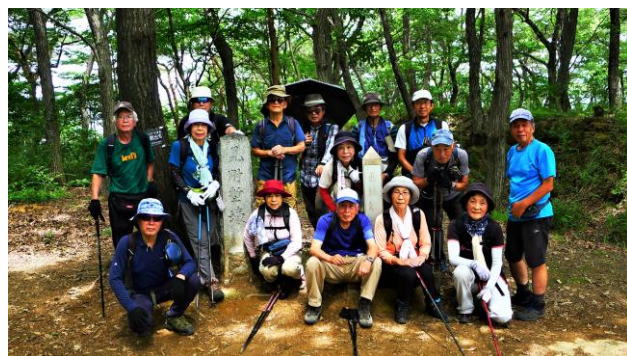
西城筋違城門跡 見付塹壕にて

S さんのストレッチで体をほぐし 10 時丁度にスタートする。今日は日差しが強いので樹林帯を歩くコースを選んだ。呑竜様本堂裏よりすぐに樹林帯に入り傾斜の緩い山道を歩き東屋で休憩。中央の階段の道を登り尾根筋に出てモータープール脇の見付け塹壕で 2 回目の休憩。展望台に寄り眺望を確認する。赤城山はカスミがかかり良く見えないが近場の足利の山々や金山アルプスは良く見えた。金山城虎口より登り日の池の北側を歩き新田神社に参拝。爽やかな風を受けながら眺望を楽しむ。筑波山は見えないが三叢山は少しガスっていたが確認できた。大小山の後ろに大平山の晃石山が確認できた。11 時 35 分南曲輪休