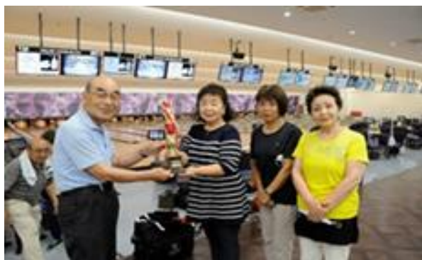
優勝グループに会長賞トロフィーを授与