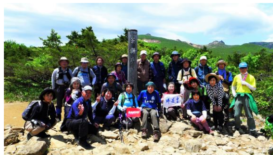
薬師岳 1354m 安達太良山山頂を背に

大泉を5時にスタート、太田桐生 IC より北関東道に乗り岩船 JTC より東北道に乗る。途中上川内 SA でトイレ休憩、台風一過を期待に胸を膨らませる。二本松 IC で降り国 459 号を走り安達太良山スキー場に 8 時 10 分到着。空は青く澄渡っていたが風が強く吹き荒れていた。建物を風除けにして身支度をしてロープウェイ駅に行くと「強風で運休」の看板ガッカリ。仕方なく薬師岳展望台に変更「この上のほんとうの空」を見に登る。