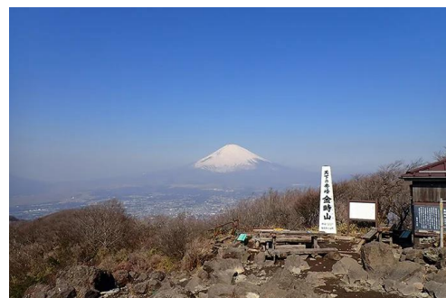
天下の秀峰金時山と富士山