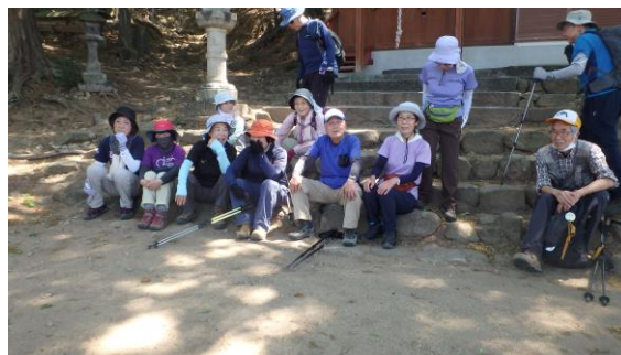
長手浅間神社の石段で