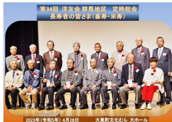
第 34 回長寿祝い者