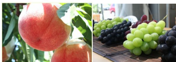
桃狩り シャインマスカット 1 房お土産