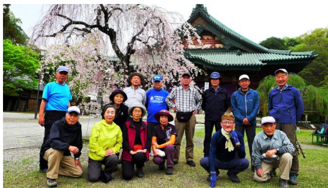
呑竜様境内のしだれ桜をバックに

第168回 5月19日(金) 行き先:足利市 彦谷湯殿山 集合場所:彦谷自治会館 集合時間:AM10時