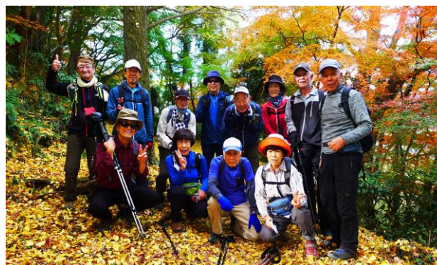
第158回新田神社裏武者走り