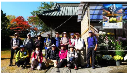
第156回大光院菊花大会 会場で