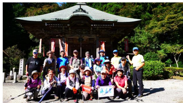
高水山 常福院不動堂にて

軍畑大橋を渡り柚木駐車場で登山支度をして再度バスに乗り登山口の平溝川橋で下車7時05分スタート。車道を平溝川に沿って歩く。高源寺の先、高水山登山口より山道に行く。砂防ダムがすぐに現れ急な階段や急な山道がしばらく続いた。ようやく山頂直下の常福院に9時10分着きホッとす。表参道の石段を登り不動堂にお参りし休憩。9時20分トイレを済ませ高水山山頂に10分程で登り記念写真を撮り、岩茸石山を目指す。きれいに手入れされた檜の樹林帯の尾根道を歩き岩茸石山に10時40分到着記念写真を撮り昼食とした。山頂は沢山の登山者で賑わっていた。眺望は良く東京都の山、雲取山、川苔山、