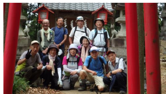
新田神社お稲荷さん前で