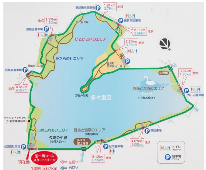
多々良沼ウオーキングマップ